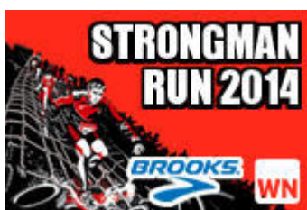
Strongman Run 2014 Jetzt für einen Startplatz bewerben