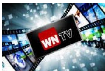
WN-TV Videos aus MS und der Region.