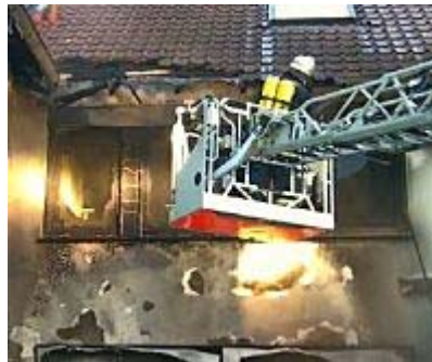
Subway-Filiale in Münster brennt aus