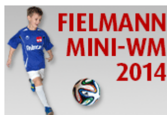
Fielmann-Mini-WM Jetzt für die Startplätze bewerben!