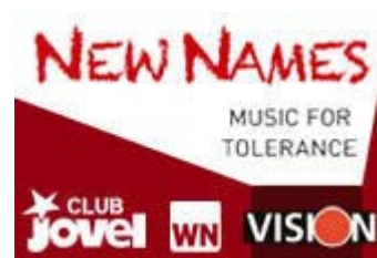
New Names Wir bieten jungen Bands Auftrittsmöglichkeiten