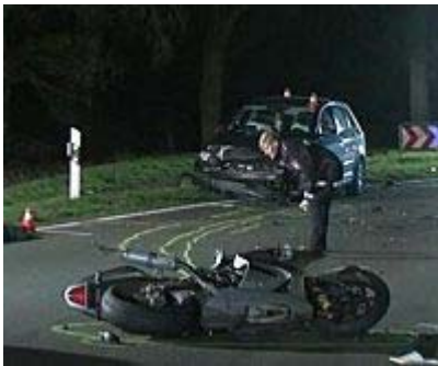
Motorradfahrer rast in den Tod