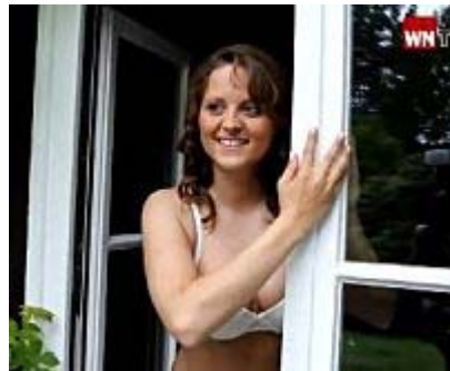
Fotoshooting für den Landflirt-Kalender