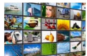
WN-Fotos Aktuelle Fotos aus MS und der Region.